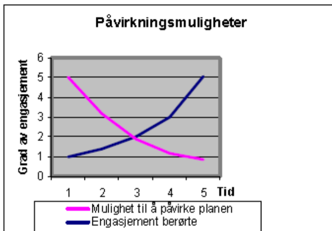
Figur 2 Grad av mulighet til påvirkning

Utfordringa for planleggaren, for å sikre innbyggjaren sin påverknad i planarbeid, vil vere å få fram engasjementet tidlegast mogeleg i planprosessen - kanskje aller helst i den innleiande fasen der framlegget til plan blir utarbeidd. Denne samanhengen kan ha noko å seie for kva slags medverknadsformer som kan nyttast. Ulike medverknadsformer blir omtala seinare i teordelen.